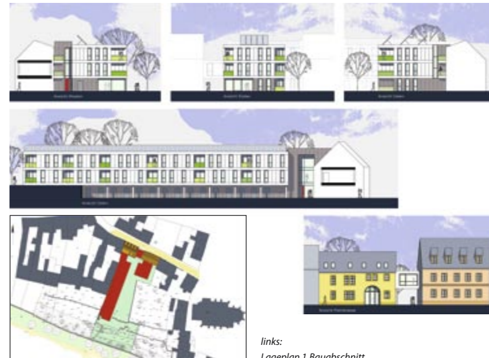
Petristraße 8/10 – verschiedene Ansichten Zeichnungen: KIRCHNER + PRZYBOROWSKI architekten bda

betrieben werden können. Deshalb ist die Förderung durch Bund, Land und Stadt unumgänglich. Die Sanierungsaufwendungen sind jedoch erheblich.