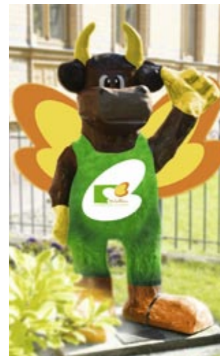
Bestaunen können Sie unseren in den schönsten Sommerfarben strahlenden Wiesi vor unserer Firmenzentrale der Wohnungsbaugesellschaft.

Wer ist der Schönste im Land? Die Wahl steht bevor. 24 Wiesi's präsentieren sich in verschiedenen Aufmachungen und warten darauf von einer Jury gekürt zu werden. Die Wobau präsentiert gleich zwei Wiesi's. Der eine erinnert mit seinen freundlichen Farben, fröhlichen Gesicht und frechen Aussehen die einen an einen farnefrohen Schmetterling, die anderen an eine fliegende Kuh. Wir wollen Ihrer Fantasie keine Grenzen setzen. Stimmen Sie für unseren Wiesi. Schicken Sie bis zum 31.08.2009 eine E-Mail an info@wiesenmarkt.de oder eine Postkarte an den Eigenbetrieb Märkte, Wiesenweg 1 in 06295 Lutherstadt Eisleben und teilen Sie unter Angaben Ihrer vollständigen Anschrift mit, wer Ihr schönster Wiesi ist. Dem Gewinner des Hauptpreises winken 2.500 kWh Strom von den Stadtwerken Eisleben. Unter den weiteren Gewinnern werden Freikarten für den Wiesenmarkt und Souvenirartikel der Wiese ausgelost. Die Gewinner werden schriftlich benachrichtigt. Der Rechtsweg ist ausgeschlossen.